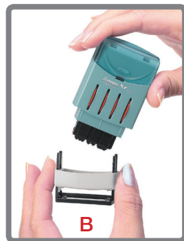
Xstamper med endast datum

För att ta bort datumdelen (A) från avtrycksdelen (B) greppa båda sidor såsom bilden visar och "vicka" på datumdelen och dra isär. Delarna är konstruerade med tight passform så man får använda lite kraft för att dela dem.