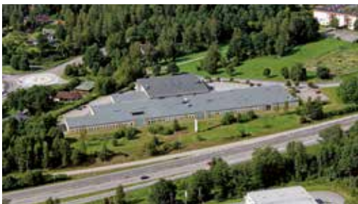
UniGraphics lokaler (2.550 kvm.)

I vårt showroom i Borås har vi samlat exempel på vad vi producerat för våra kunder. Välkommen på besök så berättar vi mer.